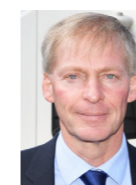
CLAUDIO ZALI Consigliere di Stato, Direttore del Dipartimento del territorio

«Non c'è niente di meglio di un solido partenariato pubblico privato per portare avanti gli obiettivi climatici in modo redditizio.»